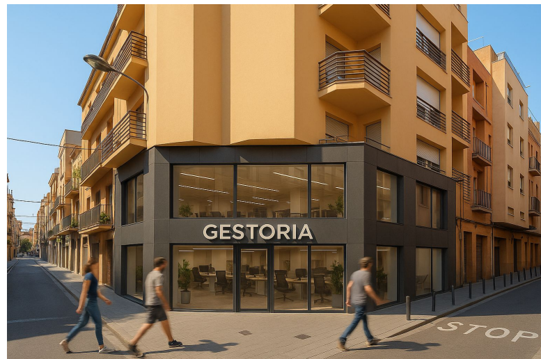
Render meramente ilustrativo. El proyecto se encuentra en etapa de obra.

IBI: 1.549€ €/año. A cargo del arrendatario Comunidad: 480€ €/año. A cargo del arrendatario